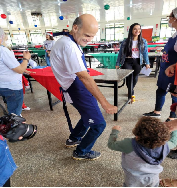
Vice-governador ao lado de sua esposa