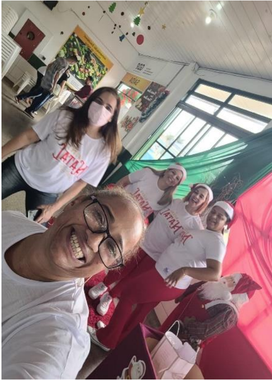
Equipe de Organizadores