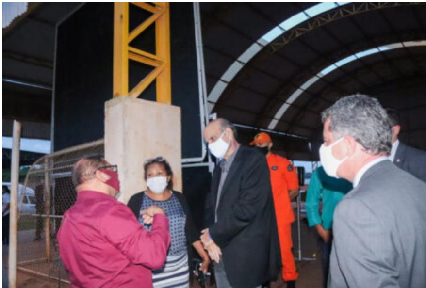
Cerimônia de entrega dos equipamentos de iluminação foi realizada no ginásio da cidade

Demanda nº Protocolo: Re-253553/2021 registrada no Ouv-DF neste evento pela ouvidoria.