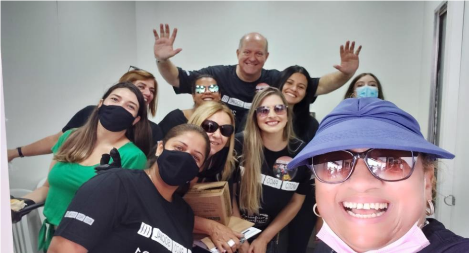
Chefe de gabinete equipe de assessoria de servidores e ouvidoria